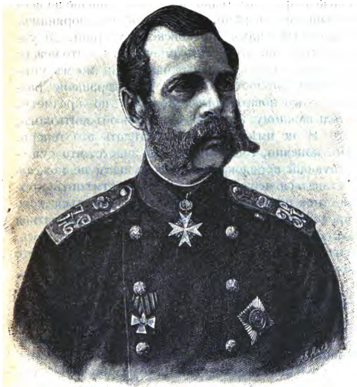
Императоръ Александръ II.